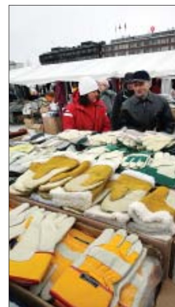
Taantuvan maakunnan pääkaupungin torilla myydään rukkasia vaikka niille on vähän käyttöä.

Tutkimuksesta vastasivat Lönnrot-instituutti, Oulun yliopiston maantieteen laitos ja Suomen